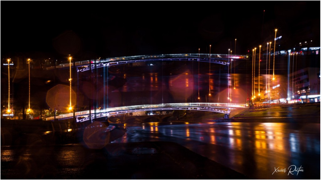
La passerelle Henri-Liébard.