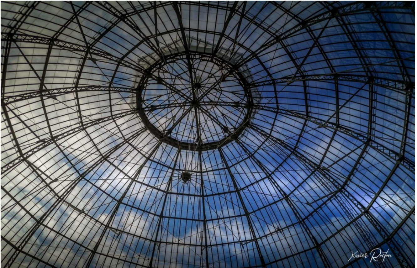
La coupole de la halle au blé – Alençon

Du lundi 19 jusqu'au 29 octobre 2020, le Centre Hospitalier Alençon-Mamers , en partenariat avec la Ville d'Alençon (61) ,